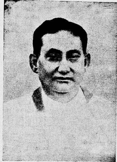
অঙ্গ-৮ কাৰৱাৰী, ১৮৭২ চন।